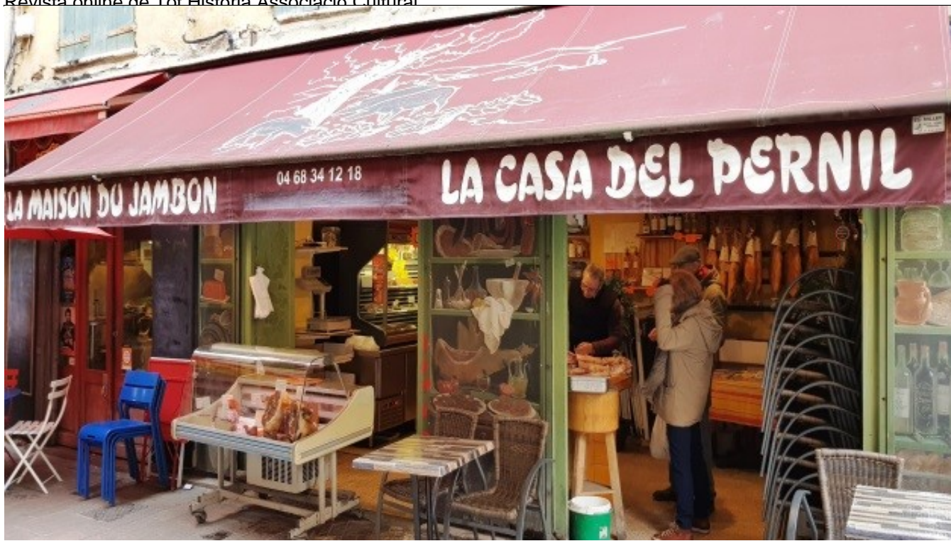
Número 4. Retolació a les botigues